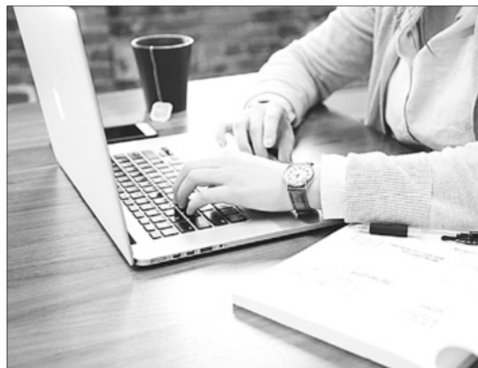
Betmedia es una empresa de base tecnológica y marketing digital enfocada en la intermediación para la obtención de clientes para las casas de apuestas y casino.

Las ventajas fiscales de Ceuta son un plus a la hora de tomar la decisión de venir