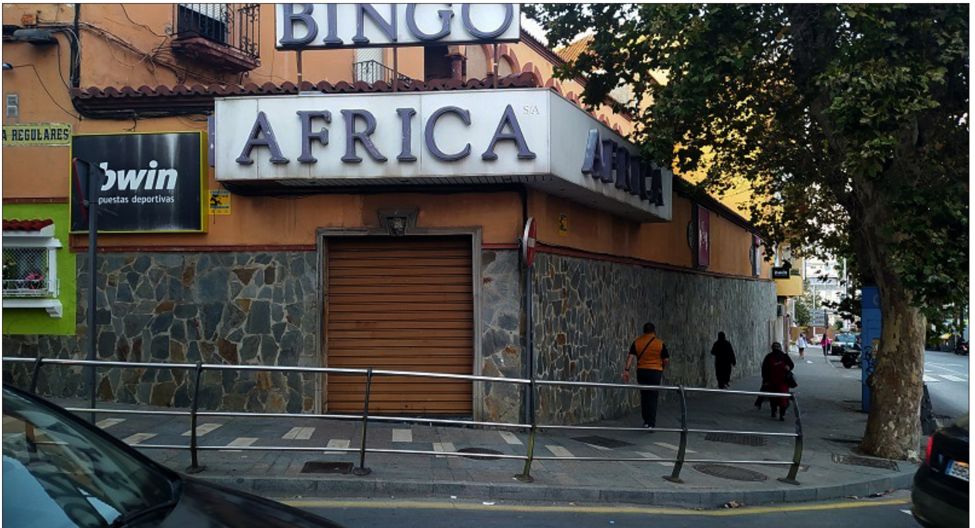
Un cartel de la empresa Bwin, donde trabaja Francisco Cerro desde hace tres años, en las calles de la ciudad autónoma de Ceuta.