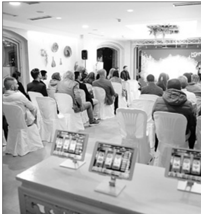
Evento celebrado en Ceuta en Terrazas El Cielo

El consejero delegado de la división online de MGA destaca la apuesta de la Ciudad por la formación de talento local en el ámbito digital