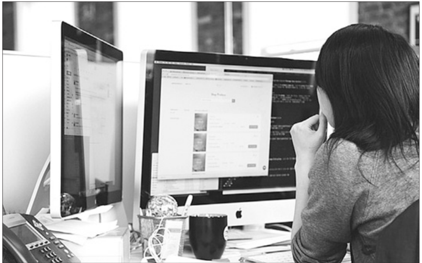
Un proyecto de Betmedia denominado Bestfy fue seleccionado como uno de los cinco para ser acelerados a través de Ceuta Open Future.

La empresa del sector del marketing digital está en pleno crecimiento en la ciudad autónoma, donde se instaló hace un año